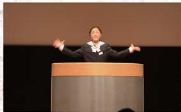
レベルの高い英語スピーチと、全身をつかったパフォーマンスをする中学生のみなさん